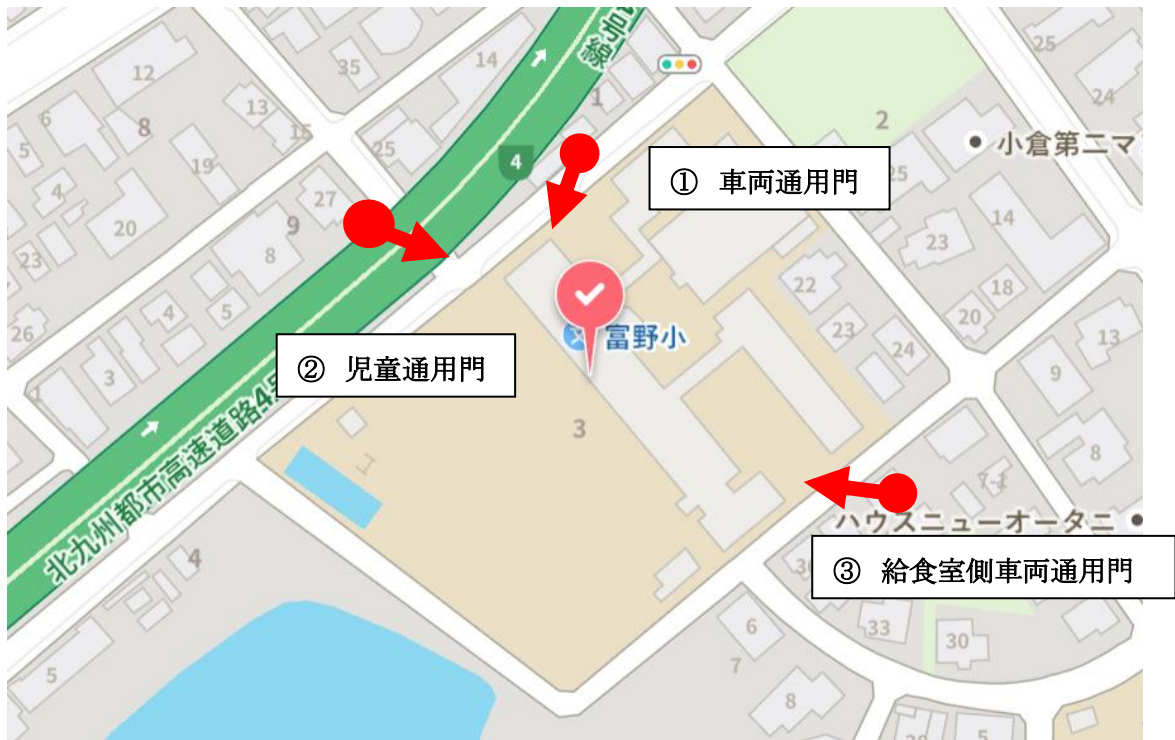
① 車両通用門(施工前)