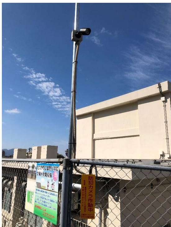
(防犯カメラ拡大写真)