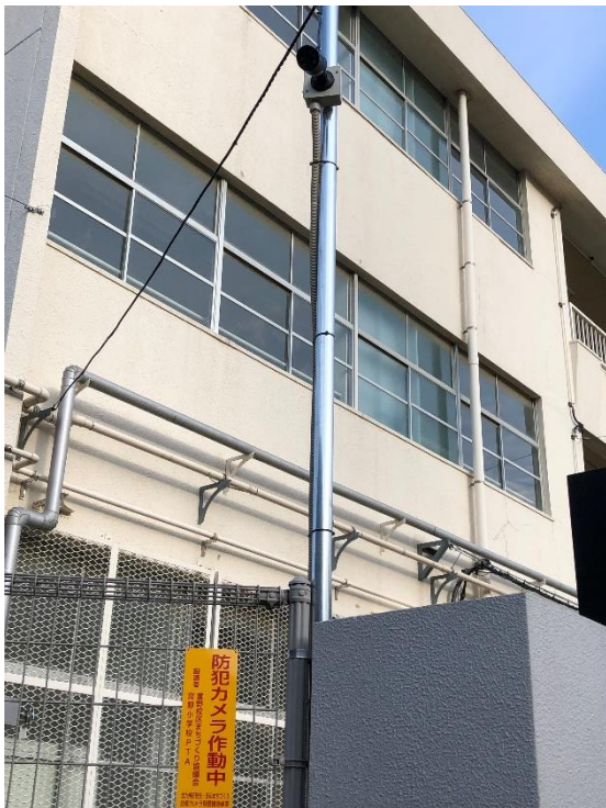
(防犯カメラ拡大写真)