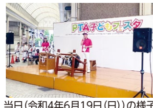
当日(令和4年6月19日(日))の様子

長引くコロナの影響で学校ではバザーやオリエンテーション、ステージ発表など様々なイベントが皆無となったこの2年弱、感染拡大に十分注意しながらも、私たち大人は活動の歩みを止める事なく、子どもたちの笑顔と思い出づくりのために、そしてひいては地域の町おこしのためにと本事業を行いました。 本事業当日は1,200名余りの来場者が訪れ、児童生徒・PTA関係者ほか保護者・商店街関係者からも喜びの声を多数いただき、三方よしの事業となりました。 反省点は多々あるものの、その反省点を見据えたうえで次回を望む声も多くあり、継続事業として運営していくか、今後に向けて協議するところとす。