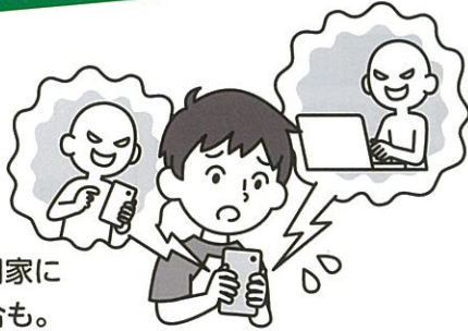
パソコンや携帯電話等を使ったいじめの認知件数